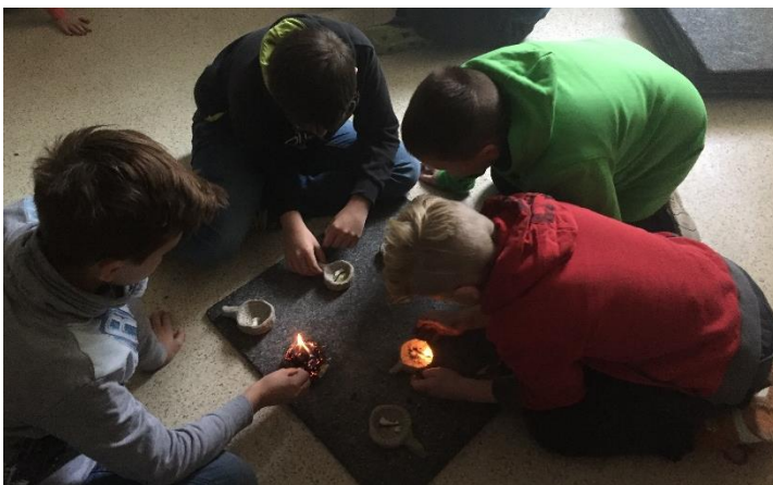
Es muss vorsichtig in den Zunder gepustet werden, um die Glut zu entfachen.