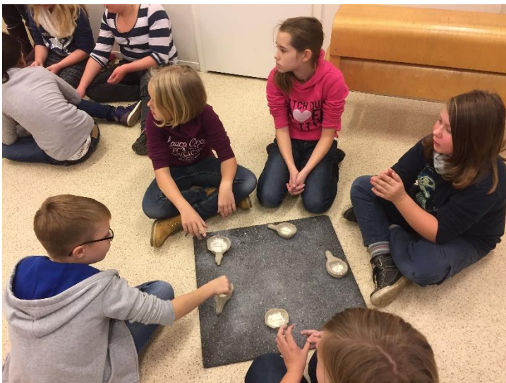
Jeder Schüler hat ein kleines Feuergefäß geknetet.