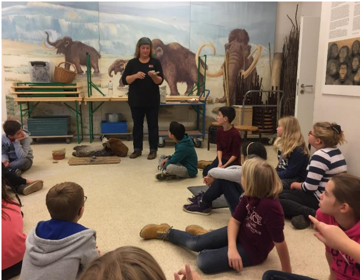
Wie machten die Steinzeitmenschen eigentlich Feuer?